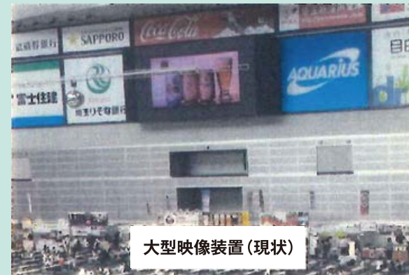
大型映像装置(現状)